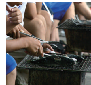
ニジマスを炭火で焼きます