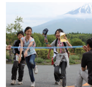
皆で味わう一体感