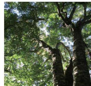
樹齢数百年の巨木

● 「富士山青木ヶ原樹海等エコツアーガイドライン」の人数規制により、グループの人数調整をお願いする場合がございます。