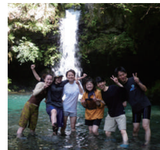
メインの滝をバックに