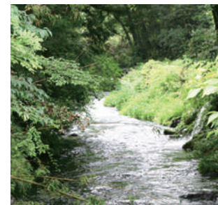
至るところから湧き出す豊富な水