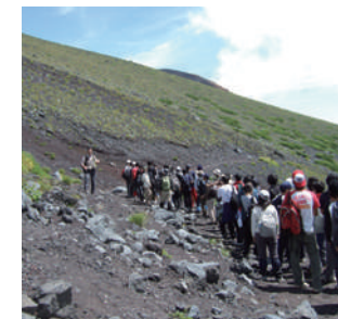
天気が良ければ山頂もばっちり