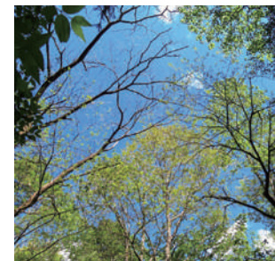
季節によって楽しみ方が違う