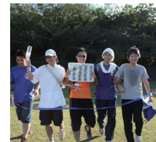
制限時間に間に合うようにゴール