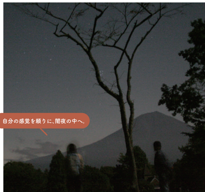
自分の感覚を頼りに、闇夜の中へ。

静寂が支配する夜の闇へと出かけます。五感を研ぎ澄まして静かに自然と向き合うことで、野生動物の気配を感じたり、自然との一体感を味わえます。