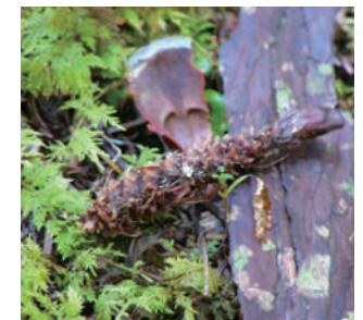
道の途中で見つけた“森の落とし物”