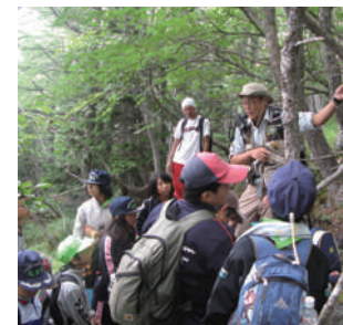
途中では動物の痕跡も