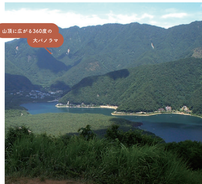
山頂に広がる360度の 大パノラマ

紅葉台（1,165m）・三湖台（1,202m）に登る、初級レベルの軽登山。 富士山の広大なすそ野とそこに広がる青木ヶ原樹海・西湖畔の絶景をお楽しみ頂けます。