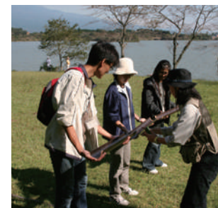
様々な課題にチャレンジ